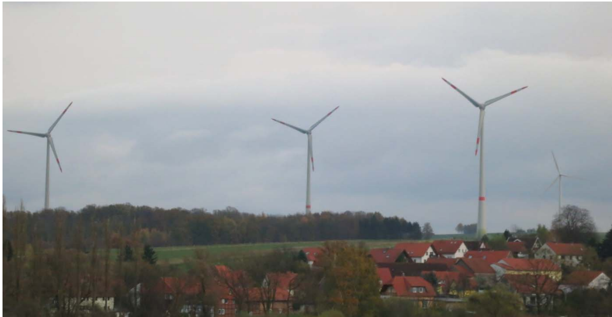
Anlagen der „200m Klasse“ bei Bischhausen / Göttingen mehr als 1000m Abstand vom Ort