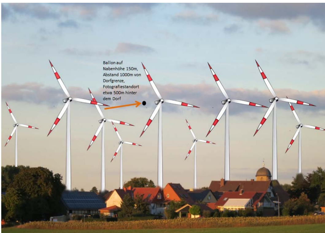
Sichtsimulationen geplanter WKAs vor Barterode bei Göttingen (> 200m) (durch Geographen validierte Anlagenpositionen in Höhe und Abstand) 1200 m Abstand vom Ort