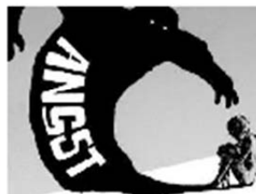
Depression und Angst-erkrankung